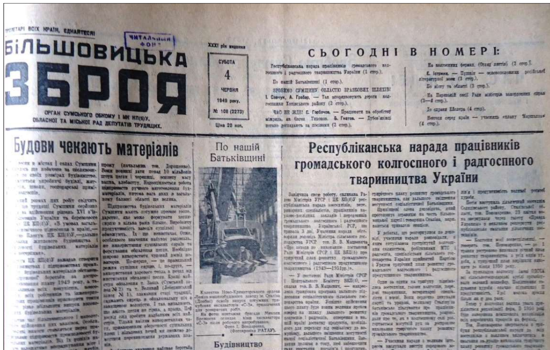
Фото 2. Передовиця газети «Більшовицька зброя» за 4 червня 1949 р. зі статтею, присвяченою проблемі виробництва будматеріалів на Сумщині

У 1948 р. підрозділи «Укрпромсільбуду» отримували лише 58 % від необхідної кількості цегли, 53 % – металовиробів, 51 % – в'язучих матеріалів, 36 % – покрівельних матеріалів і 33 % – лісоматеріалів [13, арк. 5]. Приблизно в той же час рівень забезпеченості «Цивільбуду» цеглою складав 23 %, а в'язучих матеріалів – взагалі 10 % від встановленої потреби [10, арк. 15].