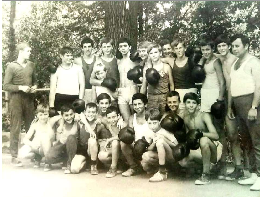
Фото 1. Боксери-юнаки ДСТ «Зеніт» КФК «Металіст» в спортивному таборі. 1973 р.